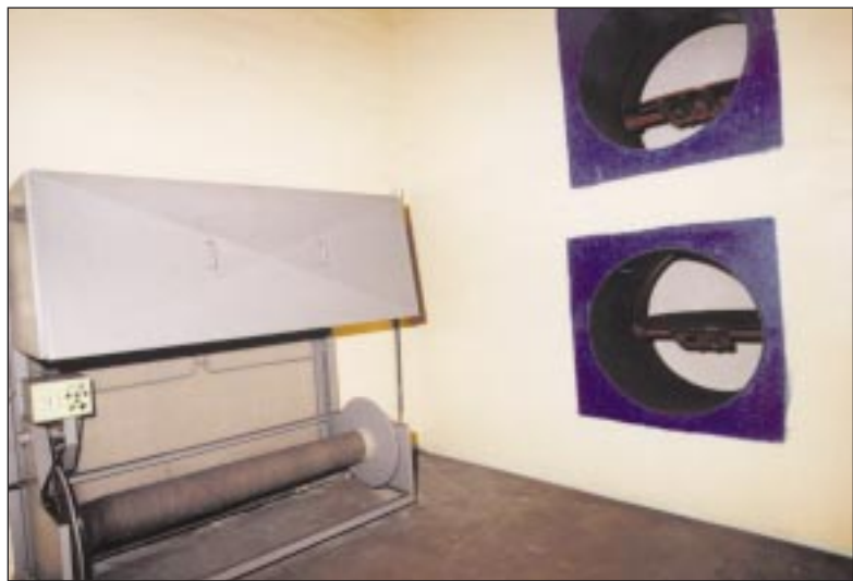
To, co působí jako avantgardní dílo současného umělce, jsou větrací průduchy. „Mandl“ vlevo je ve skutečnosti prachový filtr: filtrovací látka, která je už znečištěna, se navíjí na spodní válec.

prosím. Ale prý zvlášť pro ženy a pro muže. A někde snad také sprchy, ale pořádku. A ještě něco zpravidla přehlídíme: poměrně složitý systém dveří, které jsou schopny během čtvrt hodiny udělat z ochranných prostor vzduchotěsnou komoru. Slovo „dveře“ je tu vlastně nedopatřením: jedná se o kolosy s vahou desítek tun. Některé se jen otočí, jiné vyjedou z podlahy; ve všech případech se během několika desítek