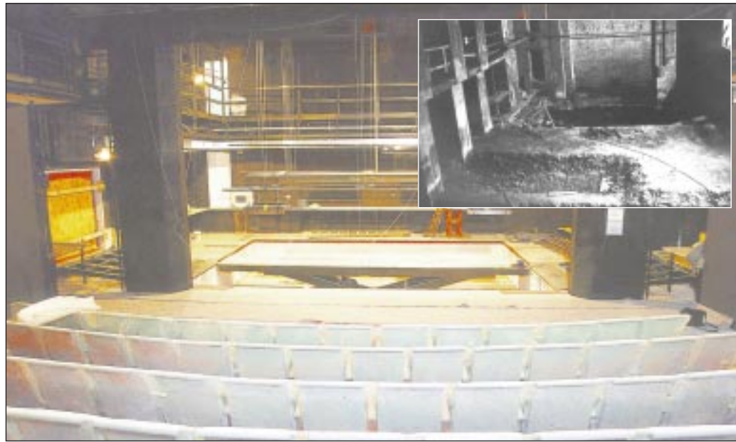
Pohled do obou hledišť divadla – původního i nově rekonstruovaného.