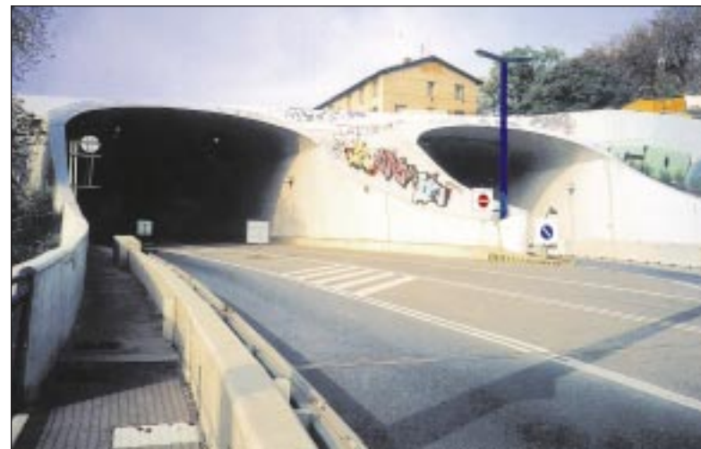
Ústí Strahovského tunelu na Smíchově

me, že má ochranu před útoky v genech. „Ano, mnozí lidé patrně mají zálibu zalézat do bunkrů,“ řekl mluvčí Senátu Helmut Löhlhoffel, „ale neshle-