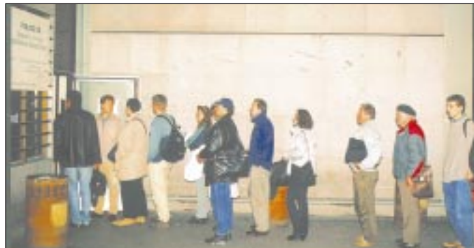
Magistrát se všemožně snaží, aby se nedůstojné ranní fronty staly minulostí.

Už v horkém létě však bylo přijato několik pozitivních kroků