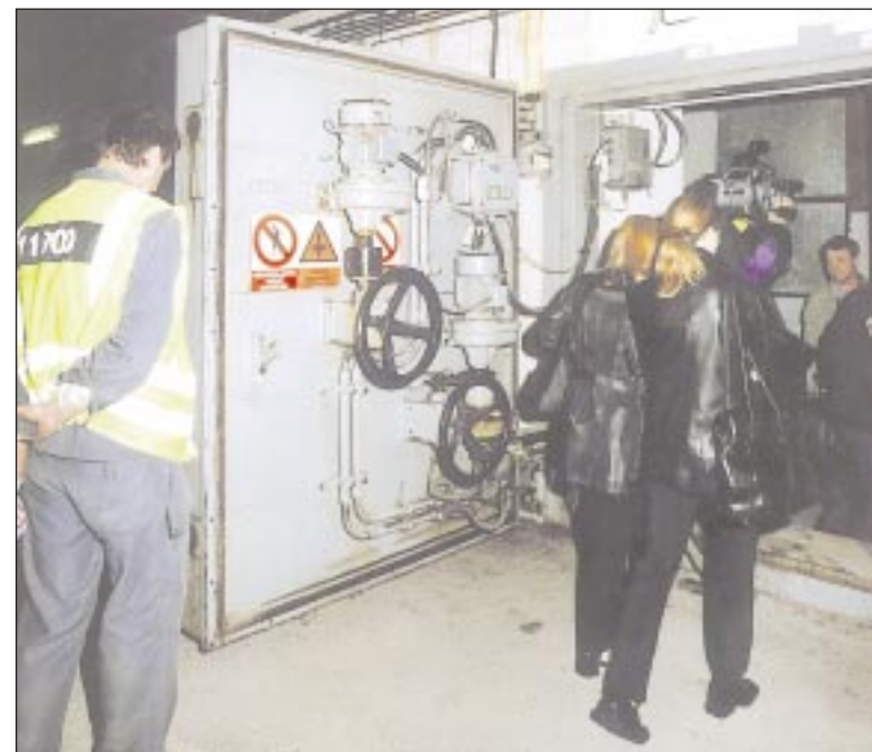
Elektromotory zavřou a utěsní několikátunový kolos během půl minuty. V nouzi nezbyde, než nasadit kliku a udělat to ručně – ve dvou lidech to trvá hodinu, někdy i více.

I v dobách, kdy nehrozí žádné viditelné nebezpečí, se o ochranný systém metra pečují. Jsou v něm zaměstnaní desítky údržbářů, instalatérů, elektri-