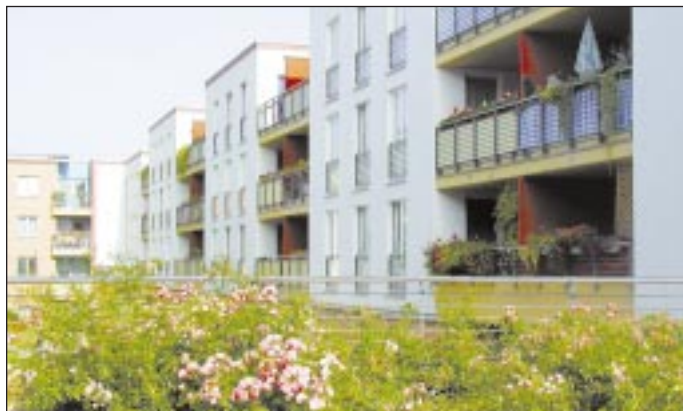
Berlínská sídliště jsou do jisté míry vzorová.

Berlínské evropanství ukazuje i diskutabilní rysy: leccos, co se staví v Berlíně, můžete téměř ve stejné podobě spatřit i v Paříži či New Yorku. Charakter města, jež má neopakovatelnou atmosféru, tu časem bude znát méně. Evropské metropole si zkrátka budou čím dál tím podobnější. Alespoň návštěvníci si takové otázky pokládají. Ostatně, v Praze si je začínáme pokládat také. (cyk)