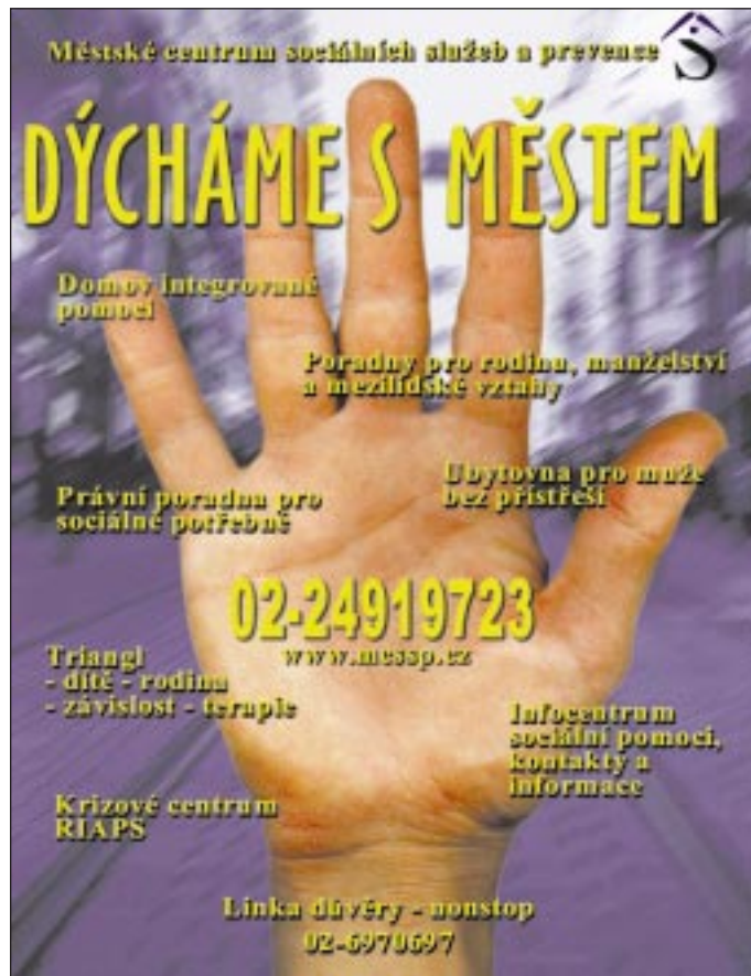
Pracovní verze plakátu, jehož autorem je Štěpán Bartoš.

V neposlední řadě provozujeme oddělení Centrum Kontakt – informační centrum sociální pomoci v podchodu metra B na Palackého náměstí, směr Sady V. Zítka. To slouží všem občanům Prahy, kteří se ocitnou před nějakým problémem a potřebují se orientovat, dostat potřebné informace, popřípadě alternativní tipy na využití sociálních služeb. V Kontaktu pracuje tým lidí, kteří dovedou odpovědně a zasvěceně poradit. K dispozici mají databáze organizací, návštěvníci si zde mohou sednout a v klidu vše produmat. Nakonec – můžete se přesvědčit sami.“ (vj)