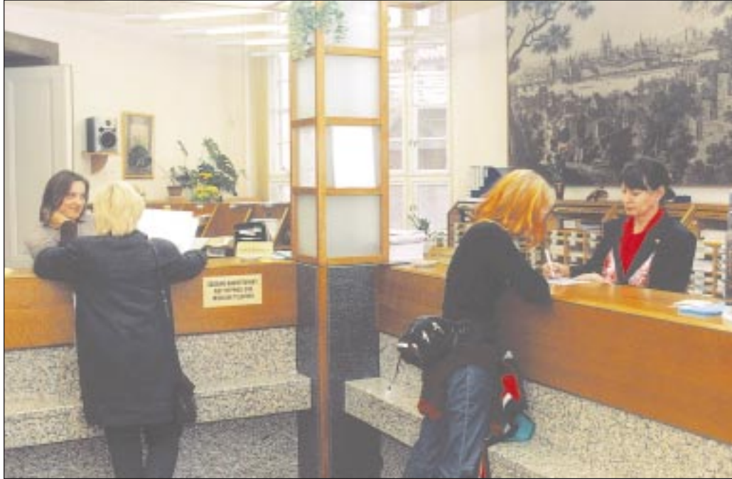
V informačním středisku bývá rušno.

Klienty zde přivítá vlídné prostředí s relaxační hudbou. Každý den jsou jim od rána do večera k dispozici asistentky, které jim nejen poradí a poskytnou potřebné informace, ale mnohdy pomohou překonat vlídným jednáním obavy z kontaktu s úřadem. V informačním středisku magistrátu mohou občané také zdarma získat nejrůznější písemné materiály, informace o činnosti úřadu, návody k vyřízení svých záležitostí, formuláře k žádostem a informace o právních předpisech města. Informační bulletin magistrátu a Adresář městských částí jsou také velmi žádanými produkty. Občané v nich najdou mnoho důležitých informací, včetně kontaktů jak na představitele města, jednotlivé odbory a útvary magistrátu, tak na všechny úřady městských částí. Jednou z důležitých činností tohoto střediska je také