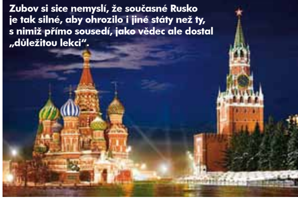
poblíznit na str. 2

„To může celé národy poblíznit. Výzvy apelující na krev a půdu by