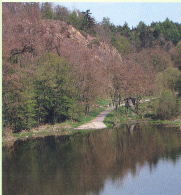
Retenční nádrž Libušská

Na bylinné vegetaci je závislé velké množství bezobratlých živočichů. Modřanská rokle také patří mezi nejcennější lokality s výskytem obojživelníků – žije a rozmnožuje se tu několik druhů skokanů a ropuch. Z plazů tu lze zastihnout ještěrku obecnou, slepýše křehkého nebo užovku obojkovou. Žije tu přibližně 60 druhů ptáků, z nichž asi polovina tu také hnízdí – asi nejnápadnější jsou strakapoud velký, datel černý, holub hřivnáč, sojka obecná a v zimě hejna sýkor, běžní jsou i brhlík lesní a šoupálek krátkoprstý a mnozí další. Obtížnější je pozorování zdejších savců – jsou plaší a mnohé druhy žijí nočním životem.