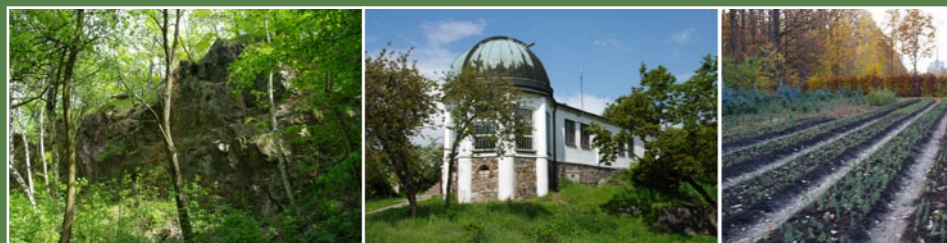
Přírodní památka Ládví

Mezi Kobylisy a Čimicemi se v 17. století nacházel dubový les zvaný Temeliště náležející k bývalému velkostatku Libeň, odkud se každoročně odprodávalo dříví poddaným. Čimický revír měl v roce 1543 69 jiter (45 ha). V nedávných letech náležel Čimický háj zemskému statku v Bohnicích. Z celkové výměry lesního majetku tohoto statku tvořil původní lesík Temeliště pouze 25 ha, ostatní plochy byly uměle zalesněné v 19. a 20. stol. Les byl tvořen zejména dubem, smrkem a borovicí.