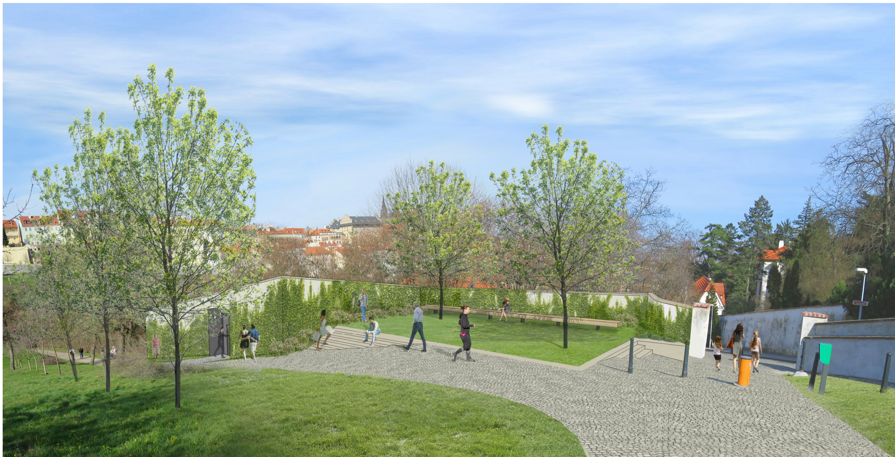
pohled ze zahrady