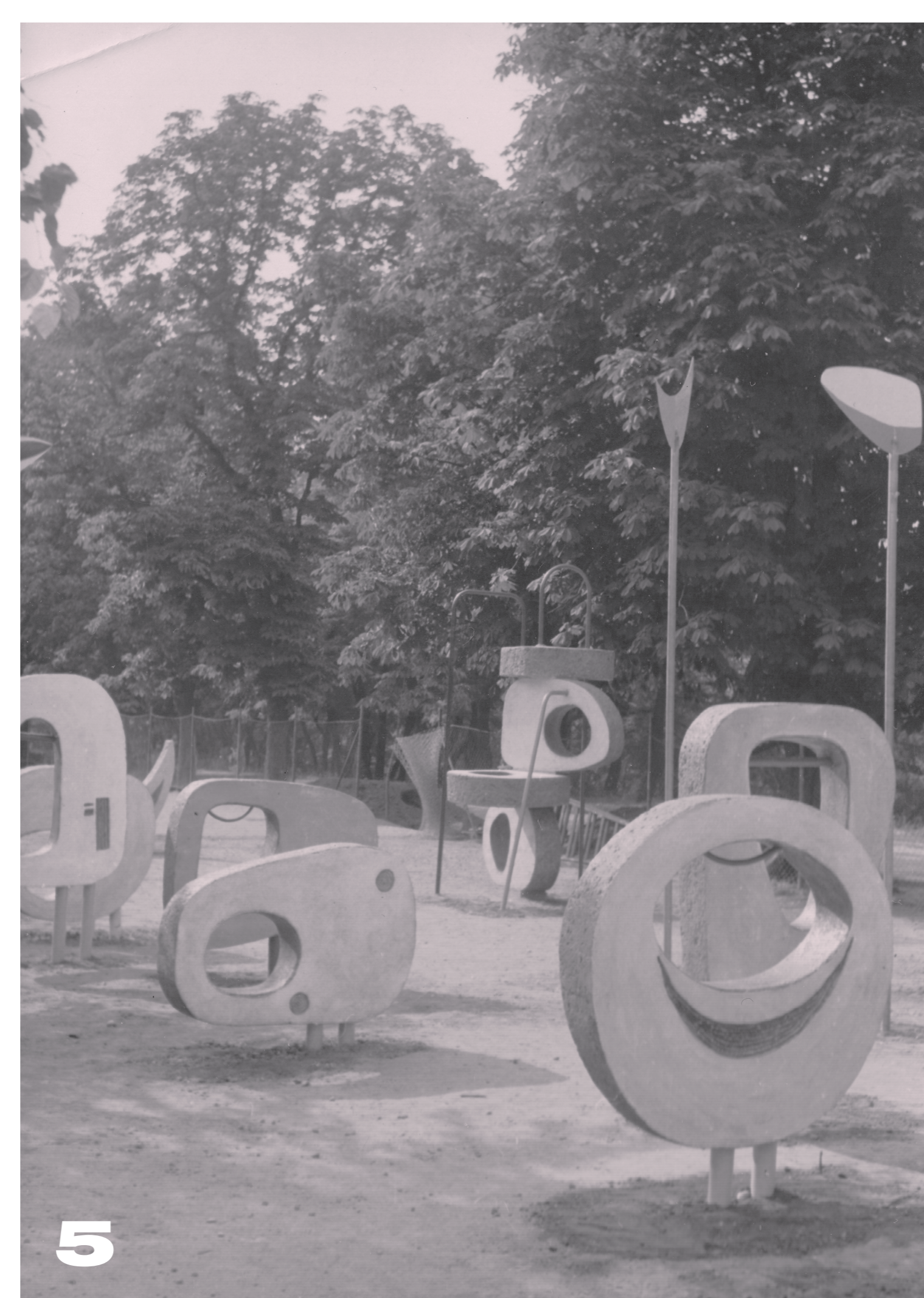
1 Eva Kmentová a Olbram Zoubek na dvorku prvního ateliéru na Židovských pecích 2 Maketa dětského hřiště ve Stromovce, 1961