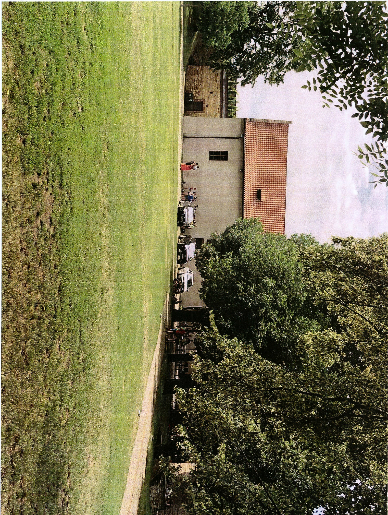
ФОТО ч. 5