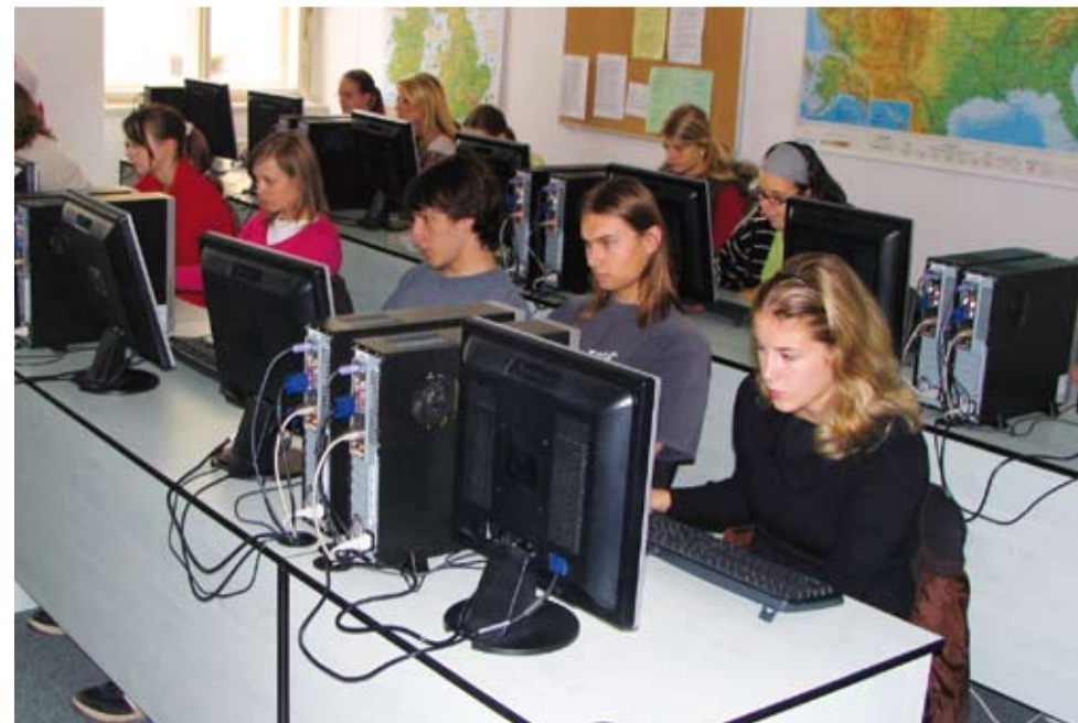
Počítačová učebna a pomaturitní kurz němčiny