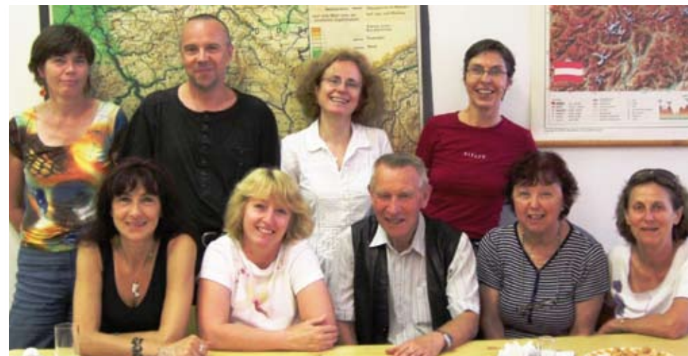
Učitelé němčiny v roce 2008