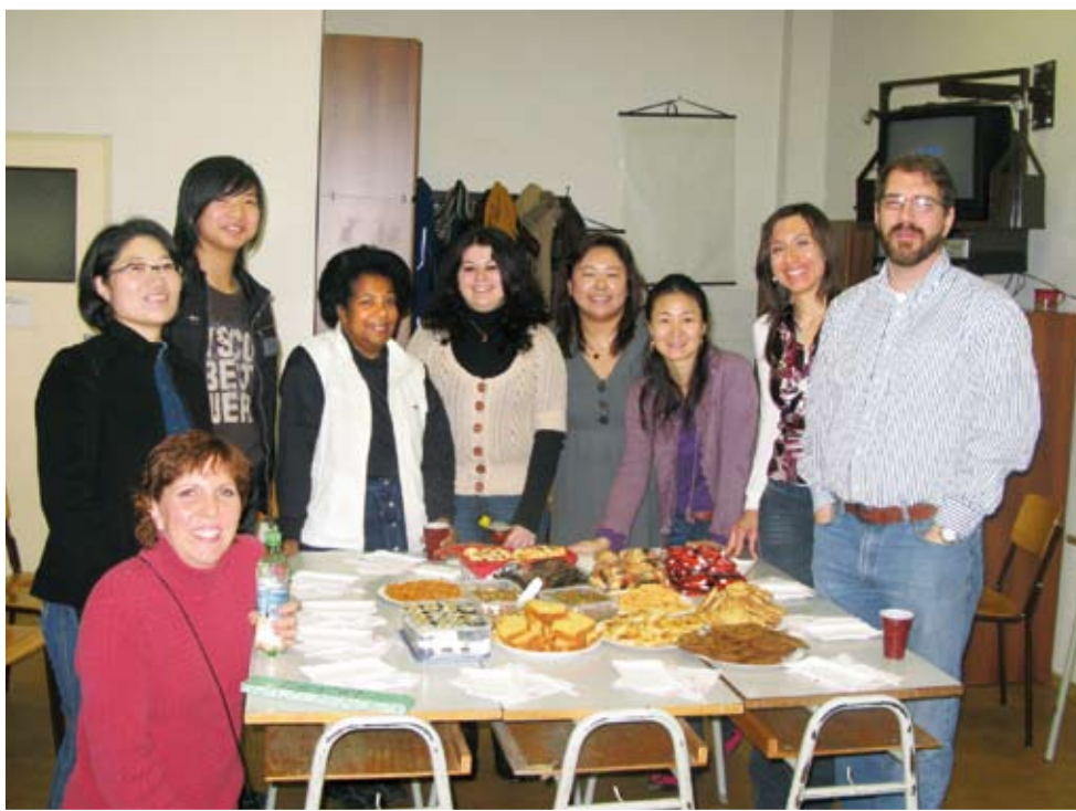
Intenzivní kurz češtiny v roce 2008/2009