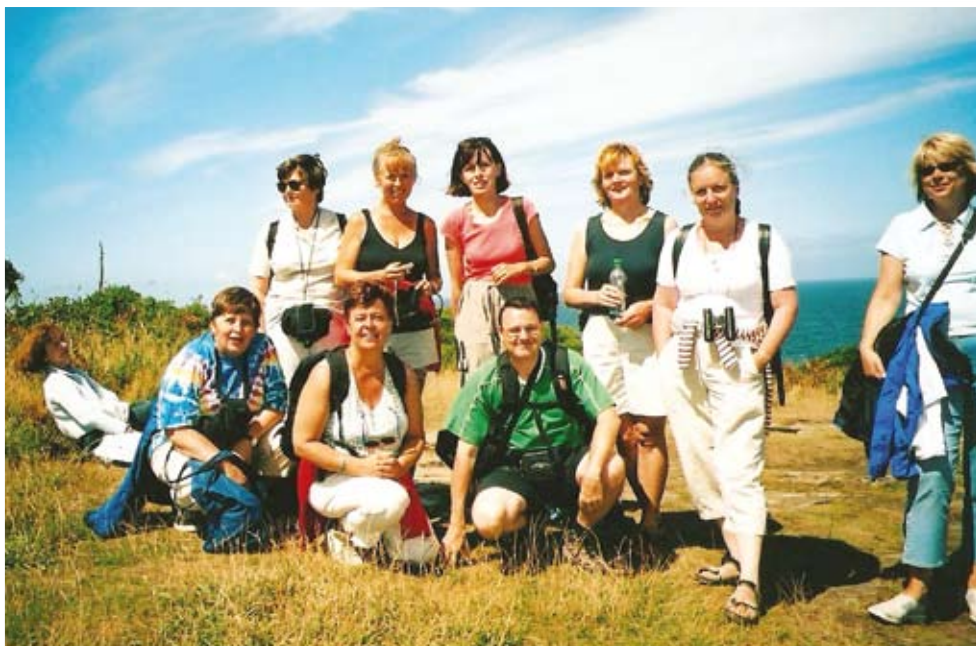
Výlet žáků a učitelů do Walesu