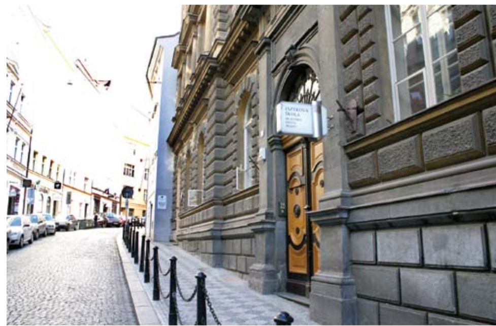
Dnešní sídlo školy: Školská 15, Praha 1