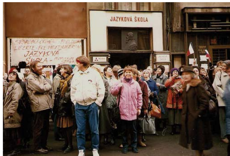
Demonstrace 27. 11. 1989