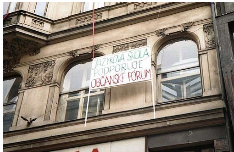
Transparent na průčelí budovy Jazykové školy v listopadu 1989

Několikrát nás z vyučování vyrušili holubi, kteří spadli do větráku. Vždycky jsme je osvobozovali. V paměti mi utkvěla podobná příhoda v den, kdy zemřel nejvyšší státník nejvýznamnější velmoci. V kurzu opět upoutávali pozornost holubi, posluchači je pouštěli ven a někdo řekl: „Jeden už natáh' brka.“ Jiný účastník akce pohotově komentoval: „To bych dnes neříkal!“ Několikere vyprsknutí naznačilo, že se situace může vymknout kontrole. Uznáte, že v tehdejších poměrech, s ohledem na návštěvy, které „možná byly, možná nebyly“, bylo nejprozíravější převést rozhovor rychle na námět probírané lekce.