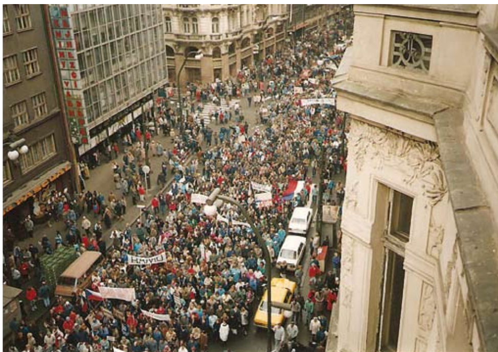
Národní třída v listopadu 1989