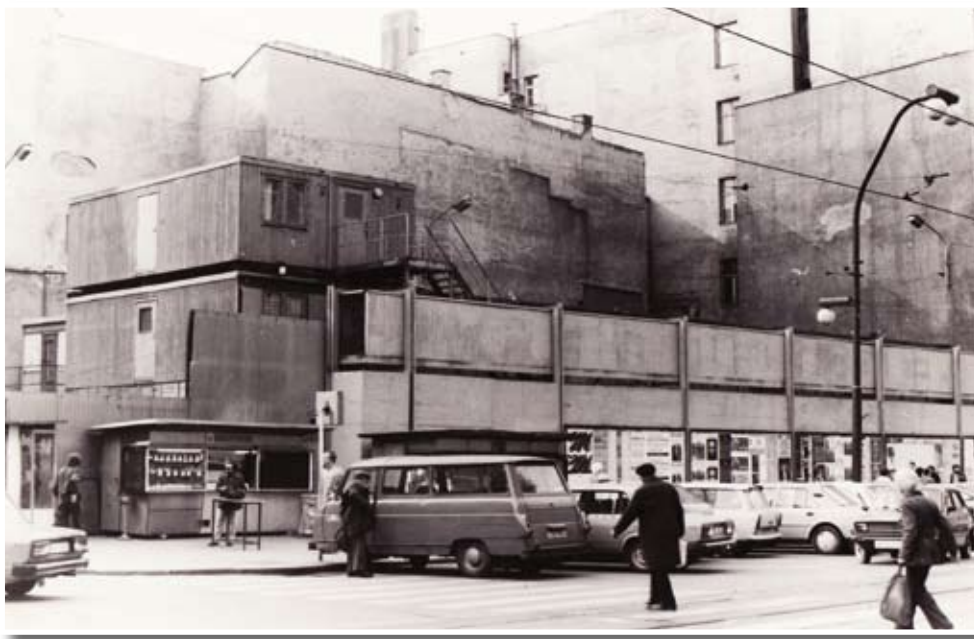
Roh Mikulandské a Národní třídy v osmdesátých letech