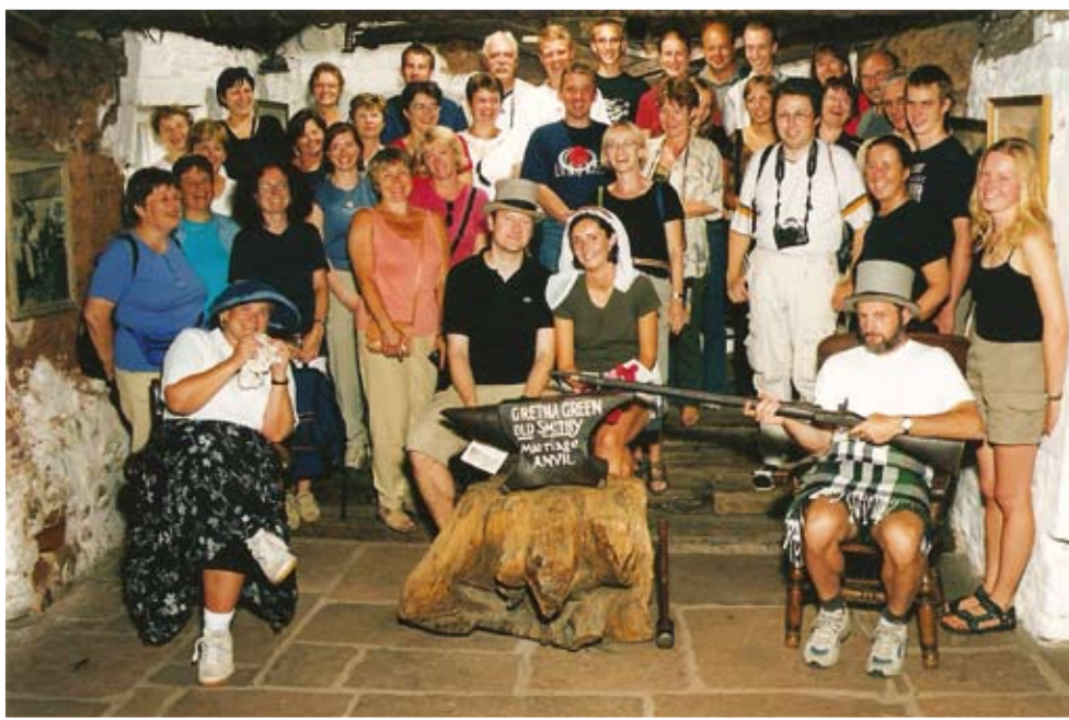
Gretna Green - výlet žáků a učitelů do Skotska v roce 2006