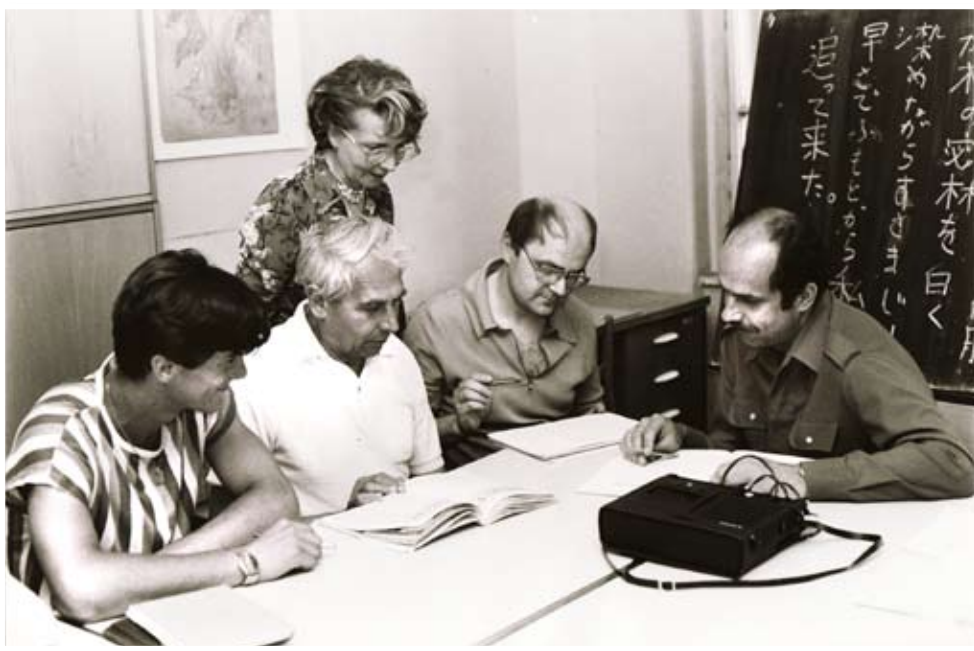
Výuka japonštiny v osmdesátých letech