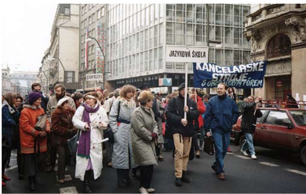
Demonstrace na podporu Občanského fóra 27. 11. 1989