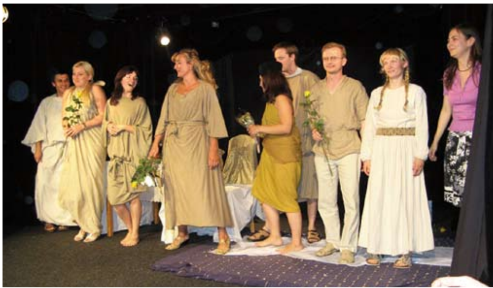
Kurz češtiny pro cizince, kde se žáci učí pomocí divadla