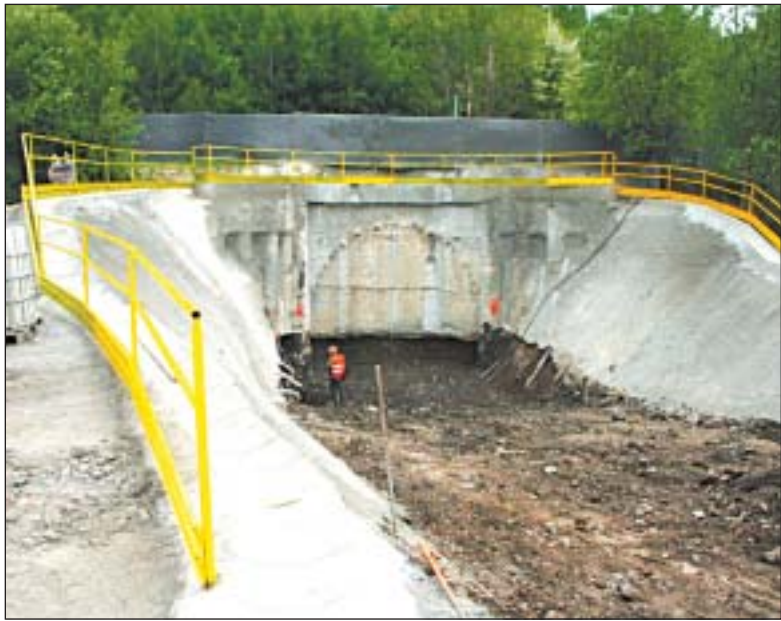
Průzkumná geologická štola na silničním okruhu Lahovice–Vestec–Jesenice.

Není potřeba rozebírat, jak je každý den obtížné dostat se v ranních hodinách do zaměstnání, pokud nepoužíváte městskou hromadnou dopravu. Praha je – nejvíce v dopoledních a podvečerních hodinách – zahlcena proudy aut, které znemožňují plynulou jízdu – a co víc, značně znečišťují ovzduší. Pokusili jsme se zjistit, v jaké fázi přípravy jsou zbylé části této pro Prahu životně důležité dopravní stavby.