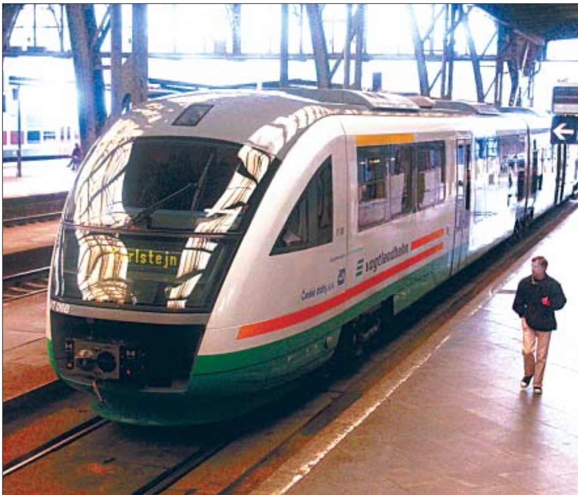
Motorová jednotka Desiro vyrobená pro saskou železniční společnost Vogtlandbahn. Koncem května ji představili v Praze, protož jen na tiskové konferenci nazvané Rozvoj regionální železniční dopravy v České republice. Svezli byste se?

Praha se k tomuto projektu bude vyjadřovat spíše z hlediska samosprávy, tedy z hlediska územního řízení a stavebního povolení. Z pohledu vedení hlavního města tedy rozhodování nezní, zda metro či železnice. Spíše je to, stručně řečeno, takto: metro rozhodně ano, a železnice – proč ne?