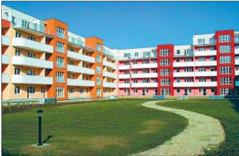
Azylem pro obyvatele z postižených bytů se stal mj. nově dokončený komplex v Praze 10-Malešicích s 253 bytovými jednotkami.

Klíčovou otázkou teď je pochopitelně obnova vodou poničeného bytového fondu, a také v této věci je náměstek primátora optimistou: „Myslím si, že jak jsou všechny nutné práce nastartovány, mohlo by být všechno hotovo – včetně Karlína – do konce kalendářního roku. Pak by se všichni, kteří se museli na čas vystěhovat, mohli vrátit. Je to obrovský úkol pro městské části. Jen oprava domů v Praze 8 bude stát 1,4 až 1,6 miliardy korun. Dohromady jsou pak v celé Praze vyčísleny škody na bytových domech svěřených městským částem na 2,6 miliardy!“