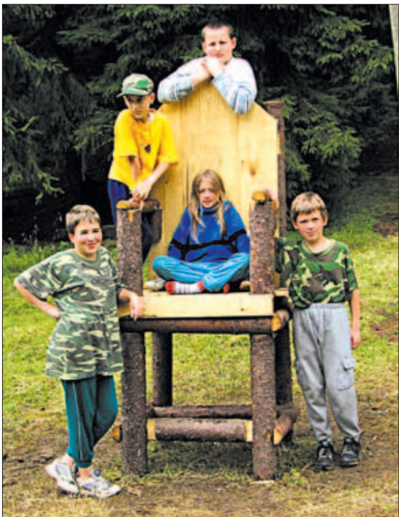
Táborníci ze stanového tábora u Kosiho potoka nedaleko Černošína, který pořádá sdružení YMCA.

Mít dva měsíce prázdnin a nejet na žádný tábor, to se dnešnímu školákovvi přihodí jen zřídka. Leckteré děti absolvují během léta tábory hned několik. Nabídka je v posledních letech docela bohatá a nikoliv nedostupná. Mnohé tábory jsou totiž zčásti hrazeny z různých grantů.