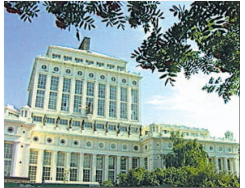
Majestátní stavba podolské vodárny vznikla ve dvacátých letech minulého století, jejím architektem byl Antonín Engel. V objektu staré filtrace vody můžete navštívit expozici Muzea pražského vodárenství – bližší informace zjistíte na čísle 02/210 95 473.

Co přesně dělá z vody surové vodu pitnou, to určují předpisy. V České republice platila původně norma, kterou v souladu s přibližováním se evropské legislativě nahradil zákon o ochraně veřejného zdraví, respektive vyhláška Ministerstva zdravotnictví. „Česká republika má ovšem oproti jiným evropským zemím velké množství povrchových vod, které jsou zdrojem pro výrobu pitné