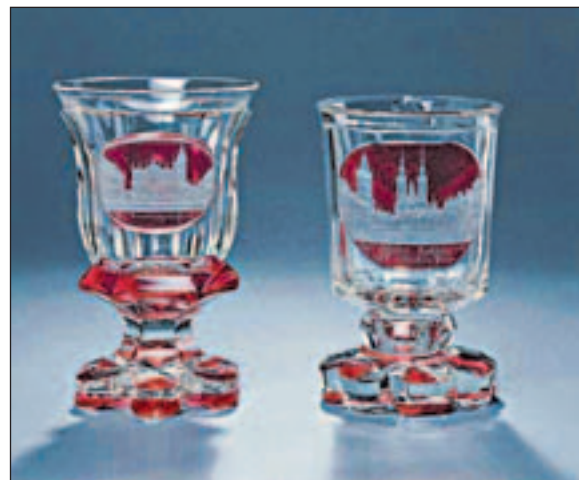
Skla s vedutami Prahy, kolem roku 1835

se sklem. Expozice nesleduje jen pražskou produkci, ale zachycuje v širších souvislostech sklo jako součást vybavení pražských domácností, jako prvek architektury či jako umělecké dílo, které se stává nedílnou součástí města.