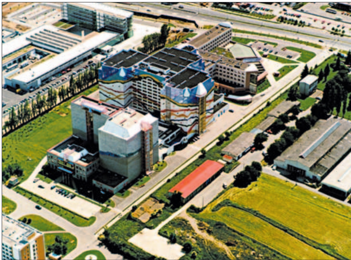
Nový archivní areál Chodovce – vlevo Archiv hl. m. Prahy, vpravo Státní ústřední archiv

To sice ano, ale kvalita ovzduší se během druhé poloviny minulého století natolik zhoršila, že ke stejné degradaci papíru, k jaké došlo předtím za tři století, dochází dnes za pouhá tři desetiletí. Ve vzduchu je tolik zplodin síry, kyselých látek a těžkých kovů, že papír žlutne, překyseluje se a začíná se drobit, lámat – stárne zkrátka desetkrát rychleji než dřív. Z dnešních archiválií, které přečkaly těch pět století, by za ta-