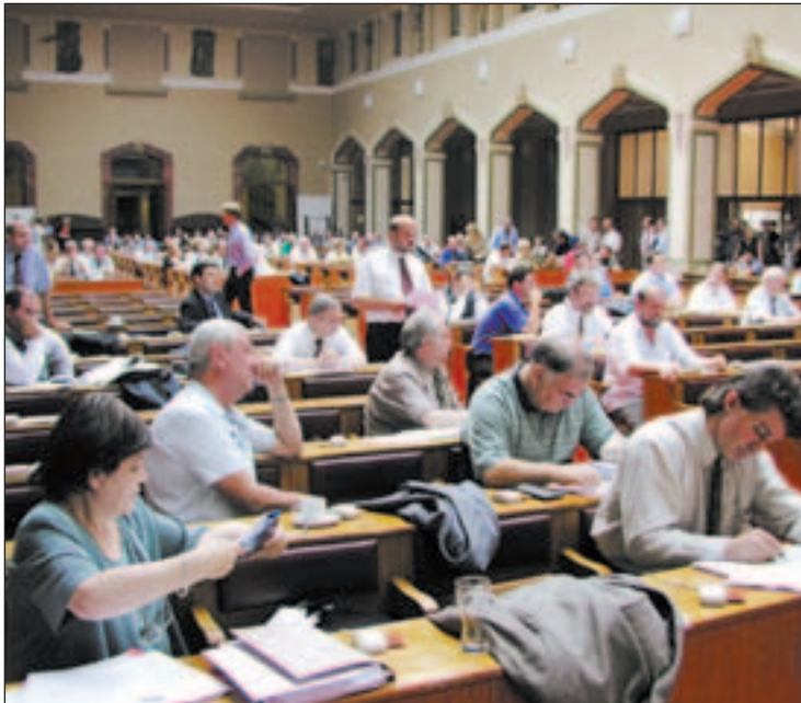
Pohled do jednacího sálu v průběhu diskuse

Zbývá dodat, že v závěru červencového jednání neprošel návrh na odprodej zbývajících 49 % akcií společ-